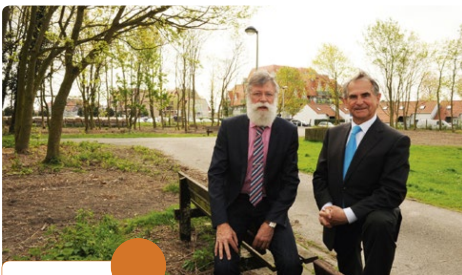
Het te vernieuwen Mauritspark.

Het Mauritspark wordt herdacht in samenwerking met Agentschap voor natuur en bos van de Vlaamse overheid